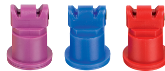
Doppelflachstrahldüsen AITTJ Turbo TwinJet Injektor

3 ab 1,0 bar und 50 cm ausreichende Querverteilung