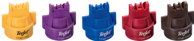
Doppelflachstrahldüsen TTI Turbo TwinJet Injektor