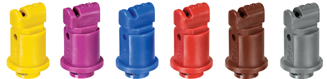
Flachstrahldüsen TTI Turbo TeeJet Injektor