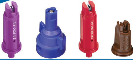
Flachstrahldüsen AI / AIC / AIUB / AIXR Air Injektor

Düsen - Feldbau / Flächenspritzung Stand 15.12.2020