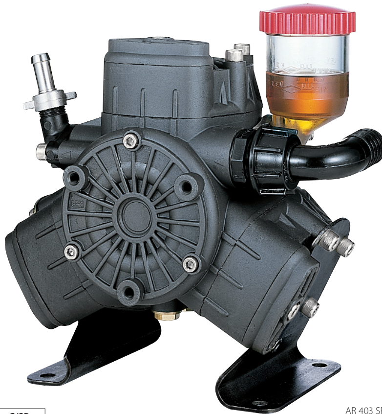
AR 403 SP